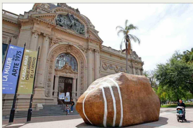
Una roca en el lugar de la escultura "Unidos en la gloria y la muerte", de Rebeca Matte, frente al Bellas Artes. Era "Palabras mayores", 2023, de Enrique Matthey.

En un mundo multicultural y globalizado, cabe preguntarse si es factible hablar de un gusto universalizado que satisfaga a la mayoría. La respuesta obvia es no. Sin embargo, por esa misma globalización y porque la sociedad está cada vez más mediada por tecnologías digitales —donde la adic-