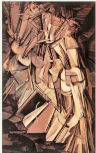
"Desnudo bajando una escalera, nº2", 1912, de Marcel Duchamp.