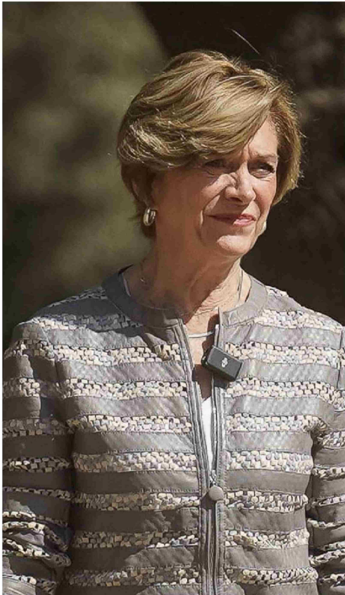
► Evelyn Matthei, alcaldesa de Providencia y abanderada presidencial de la UDI.