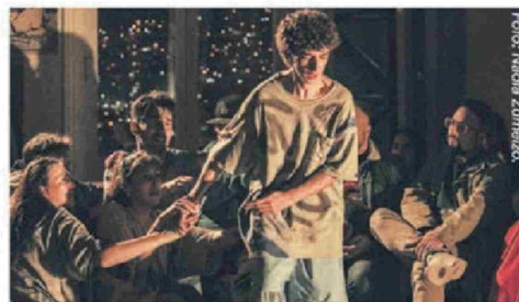
Romeo y Julieta.