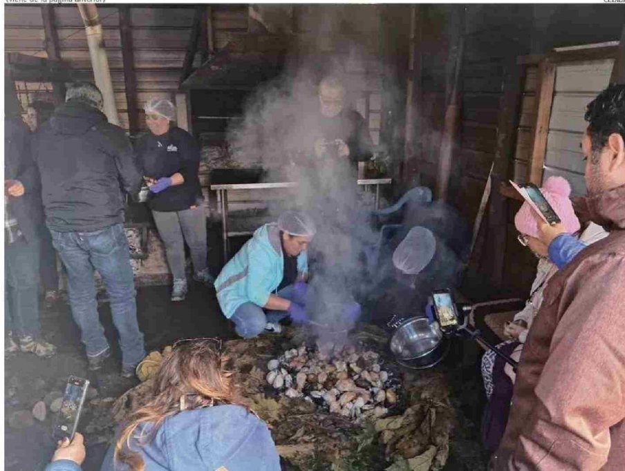
UNA DE LAS OPCIONES QUE OFRECE EL TURISMO RURAL ES DISFRUTAR DE COMIDAS TÍPICAS, COMO EL CURANTO AL HOYO.