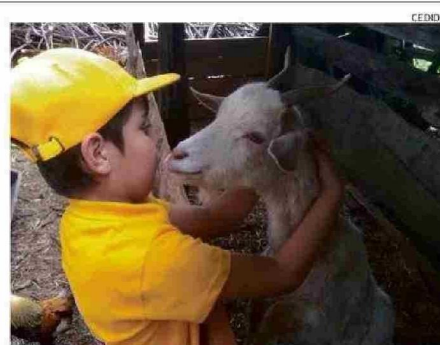
EN LA GRANJA EL RINCÓN DE ARTURITO HAY VARIEDAD DE ANIMALES.

Otro aspecto esencial para el éxito de estos emprendimientos es la difusión que se realiza en ferias asociadas al mundo rural, ubicadas en el corazón de las ciudades, como las plazas de Osorno, Puerto