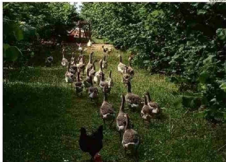
EN EL RINCÓN DE ARTURITO LAS AVES SON PARTE DE LA GRANJA.

"Todo lo que hemos construido aquí ha sido transportado en embarcaciones. Contamos con tinajas, espacios con duchas termosolares, un pequeño negocio de abarrotes, una zona de cabañas, arriendo de kayaks, paseos en lancha y, lo más importante, todo esto sin alterar la naturaleza viva de esta zona. Las personas que nos visitan buscan desconectarse de la agitada vida de las grandes urbes, y aquí encuentran esa paz. Este lugar es una bendición, algo que fue forjado principalmente por mis abuelos, especialmente mi abuela, quien falleció hace dos años a los 108 años. Su vida fue tan longeva porque era una mujer trabajadora, bondadosa y vivió rodeada de naturaleza toda su vida. Con su generosidad, qui-