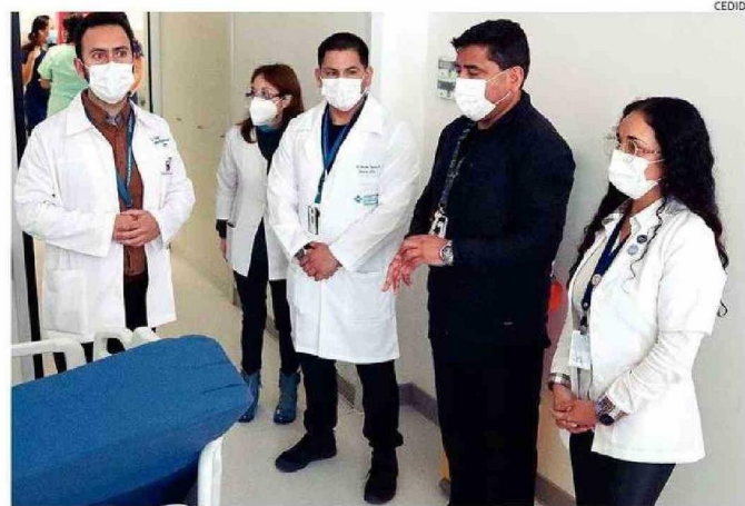
AUTORIDADES DEL SECTOR SALUD VISITARON LAS UNIDADES CRÍTICAS DEL HOSPITAL REGIONAL.