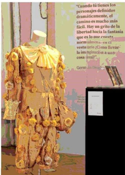
En el Taller de Vestuario y Caracterización encontraron el traje que diseñó para Taumanchen, de Hansel y Gretel .