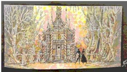
Boceto de uno de los actos de Hansel y Gretel ; Droghetti tenía un enorme talento para el dibujo.