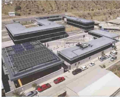
La recién inaugurada Escuela de Canela Alta cuenta con un diseño moderno y funcional para recibir a más de 400 alumnos.

En esa línea y tras el inicio del nuevo ciclo de gestión municipal 2024-2028, la compañía ha manifestado su voluntad de seguir trabajando de manera conjunta para mejorar la calidad de vida de sus vecinos y vecinas, manteniendo el foco provincial y la colaboración público - privada.