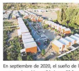
En septiembre de 2020, el sueño de la casa propia se hizo realidad para 50 familias de Salamanca. El proyecto contó con el diseño de la oficina de arquitectos Elemental, en el marco de Somos Choapa.

“Fue un proceso de más de 15 años, una lucha larga y compleja, donde hubo momentos de altos y bajos, pero al final logramos concretar este proyecto. En este proceso hay varios actores involucrados, que si no hubiésemos trabajado en conjunto no se habría podido concretar este sueño”.