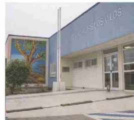
En materia de salud, en el marco de Somos Choapa se realizó el Centro de Diálisis de Los Vilos, la Posta de Salud Rural de Limahuida en Illapel, y el CESFAM de Valle Alto en Salamanca.

“Ha sido una mejora enorme para la comunidad y los profesionales que trabajamos acá. El hecho de tener una posta de primer nivel es algo muy positivo para la gente”.