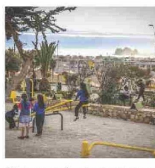
40 nuevas plazas se construyeron en la provincia a través de un proceso participativo donde los vecinos fueron protagonistas.