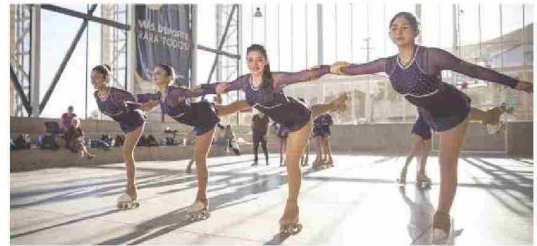
La infraestructura deportiva ha sido uno de los ejes del programa, destacando los estadios y centros comunitarios como El Polígono de Illapel.