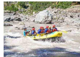
El rafting es un clásico.