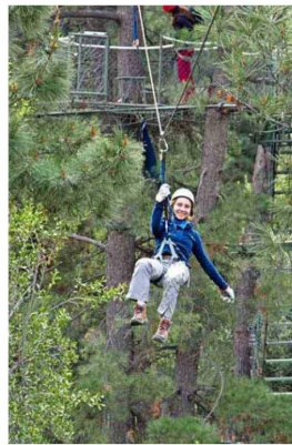
Canopy por el río Maipo.