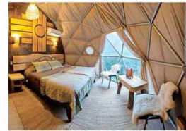
Borderío: cómodo y acogedor.

En una agradable mañana de marzo, viajamos 50 kilómetros al sur de Santiago hasta la comuna de San José del Maipo. Rápidamente nos internamos entre montañas y bosques, con el gran río Maipo a nuestros pies, hasta alcanzar la localidad de San Alfonso. Allí, ubicada dentro de una reserva natural, nos espera el famoso centro ecoturístico Cascada de las Ánimas, hasta donde llegamos con un objetivo principal: conocer sus recién inaugurados lodges Borderío .