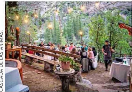
Restaurante La Tribu.