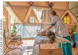
El hotel cuenta con un spa.