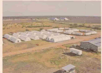
Campamento minero instalado por Nómade Chile combinando soluciones móviles y semirígidas.

Paralelamente, cuenta con un sistema que acumula y separa