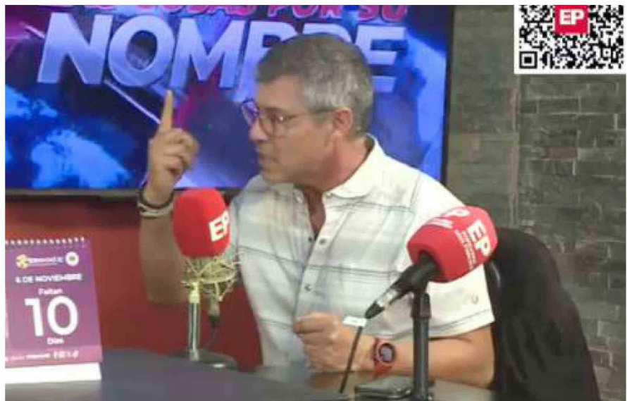
EL PRESIDENTE REGIONAL DEL COLEGIO MÉDICO AFIRMÓ QUE EL SISTEMA NO SÓLO ESTÁ PRESIONADO POR UNA MAYOR CANTIDAD DE PRESTACIONES, MAYORES BENEFICIOS Y UN MASIVO AUMENTO DE USUARIOS.

“Efectivamente, el Gobierno Regional no tiene ninguna obligación de hacerlo, pero ahora lo hicieron porque estamos en una situación bastante fea en este sentido. Cuando hablas con las autoridades, te dicen que