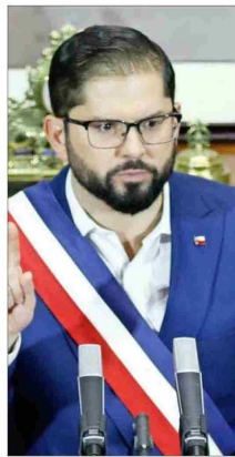
Gabriel Boric, Presidente de la República.

Al respecto, Paulina Vodanovic, timonel del PS, dijo que "fue una buena reunión de discusión política, donde el Presidente da cuenta también de ser el líder de