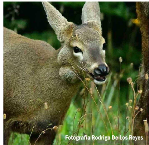
Fotografía Rodrigo De Los Reyes