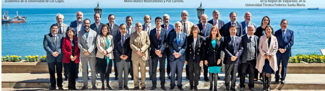
El Consejo de Rectoras y Rectores de las Universidades Chilenas (Cruch) tuvo sesión en la Región de Valparaíso, en la Universidad Técnica Federico Santa María.