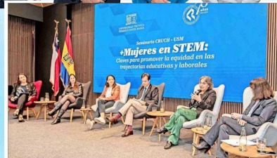
En el encuentro también se desarrolló el seminario "Mujeres en STEM: claves para promover la equidad en las trayectorias educativas y laborales".