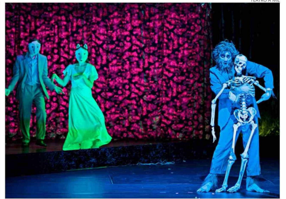
“Lapis Lazuli” solo tendrá tres funciones en el Teatro Municipal de Las Condes.

El griego relata que coincidió con Pina dos veces en su vida. Una de ellas como encargado de vestuario en un