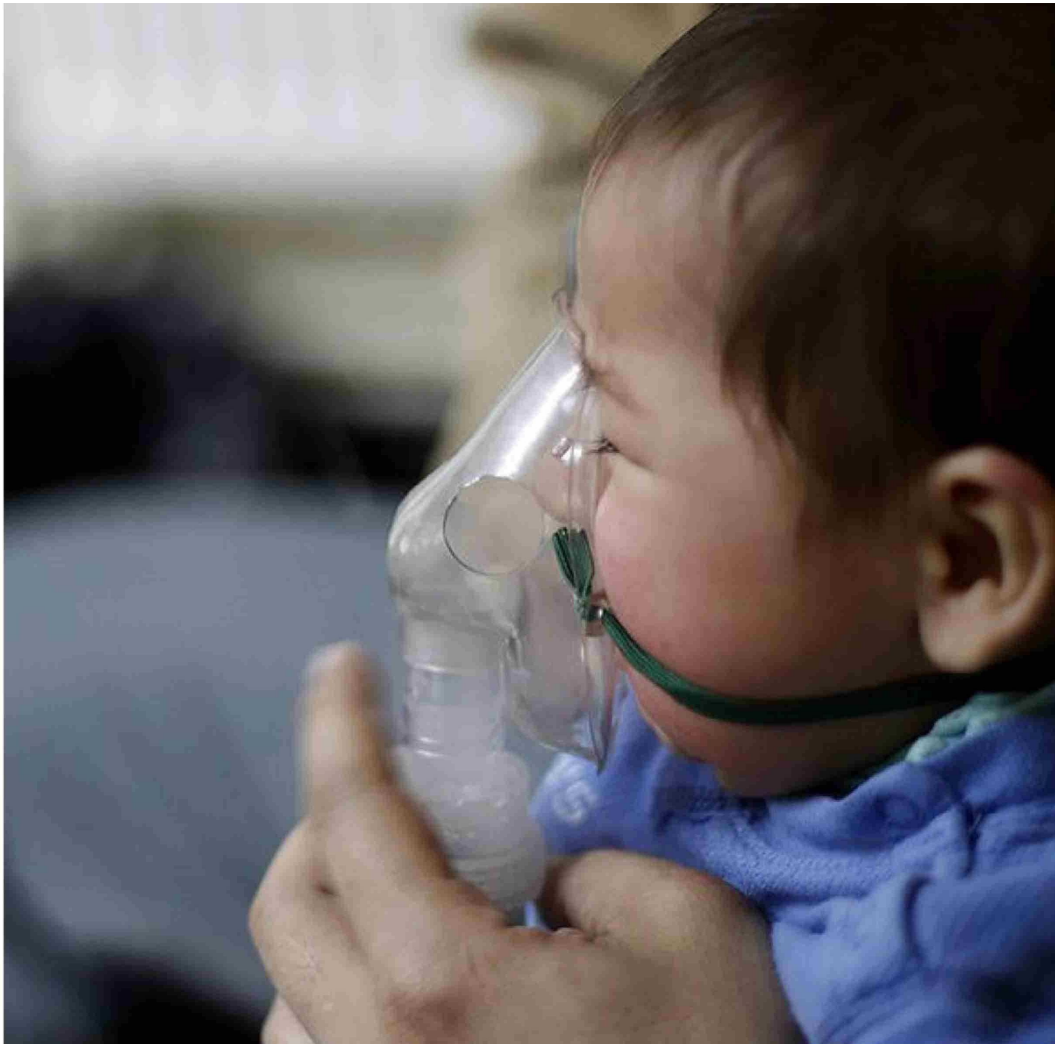
► Esta es una de las principales enfermedades respiratorias graves en niños pequeños, lactantes y adultos mayores.

no solo valida la rigurosidad y calidad de la investigación, sino que también pone en valor el aporte de la ciencia chilena al desarrollo de soluciones globales en salud.