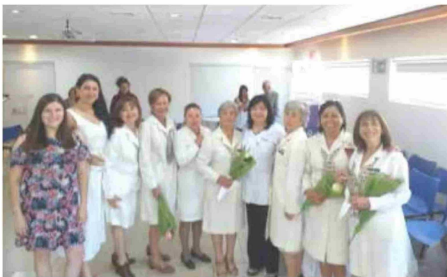
Miembros del Voluntariado de la Liga Contra la Epilepsia en Talca.