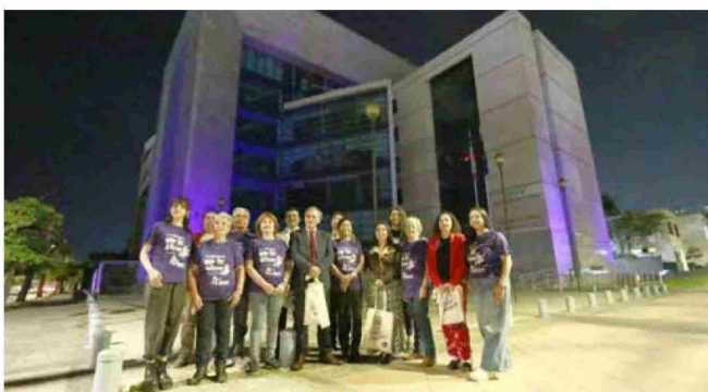
En Talca, el edificio de la Corte de Apelaciones se iluminó en conmemoración del “Día Púrpura por la Epilepsia”.