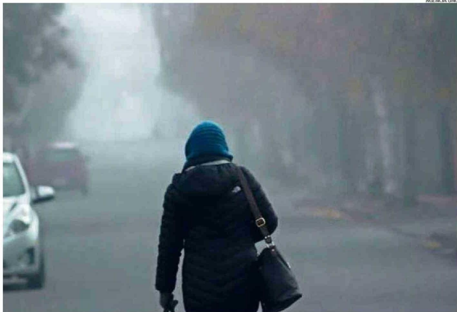
CHILLANEJOS HAN RECURRIDO A DISTINTOS MECANISMOS DE CALEFACCIÓN.

SISTEMA FRONTAL. A raíz del fenómeno meteorológico presente, es que se proyectan bajas temperaturas para la región este fin de semana.