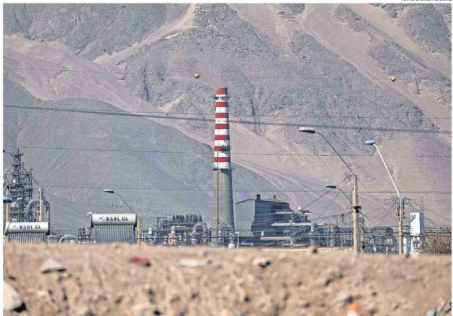
KARL CHINGA GRAWE

Además la congresista valoró el avance del royalty minero, el copago cero y apuntó a hacer énfasis en salud, educación y vivienda.