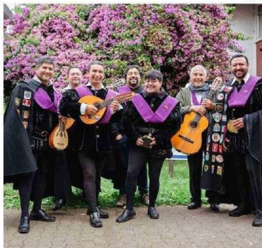
CON UN CONCIERTO GRATUITO FESTEJARÁ HOY LA TUNA UFRO.