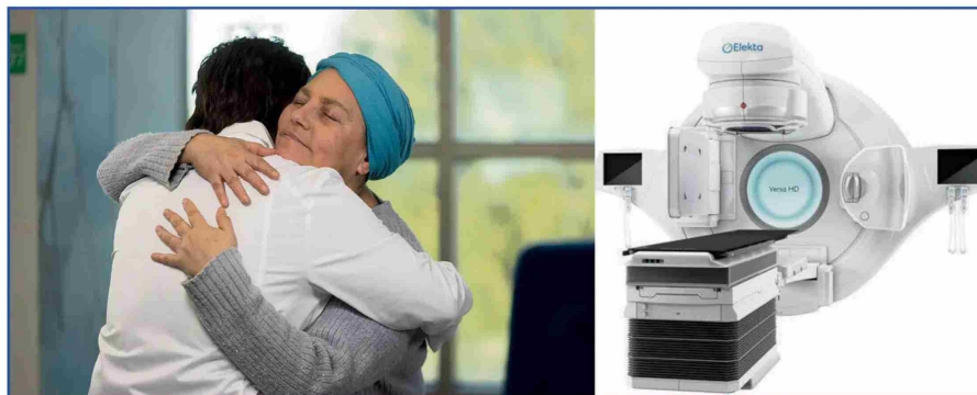
Equipo de Radioterapia que estará en funcionamiento en 2026

Con una inversión total de US$36 millones , la Clínica Andes Salud de Talca será la más grande de la región del Maule al considerar 92 camas totales , incluyendo una Unidad de Pacientes Críticos (UPC) con 18 camas intensivas , que aumentará significativamente la capacidad de atención a pacientes de mediana y alta complejidad. Así mismo, contará con 6 pabellones quirúrgicos y un Servicio de Urgencia de primer nivel , lo que incrementará la capacidad para realizar cirugías, esenciales para reducir las listas de espera que han afectado a la región y mejorará la atención de emergencias médicas. También se