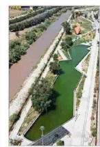
Incivildades y robos lo han deteriorado.

> Buzos encuentran sin vida a otras tres personas y se elevan a siete las víctimas fatales. > Embarcación con permiso de zarpe para 26 pasajeros trasladaba a 34, sin más tripulación que el patrón y una menor de edad. | c 9