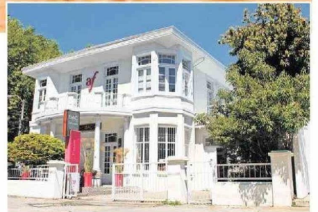
Luego de terremoto de 2010, la Alianza inauguró su sala de teatro.

te la pandemia siempre preguntaban por redes sociales cuándo volvía el ciclo.