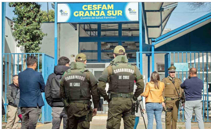
En primer trámite constitucional del Senado se encuentra el proyecto sobre infraestructura crítica, que incluye los recintos "cuya afectación cause un grave daño a la salud". En la foto, el Cesfam de La Granja.