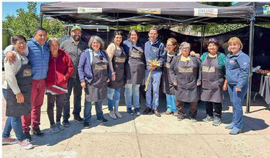
Mercado Campesino de Rancagua.