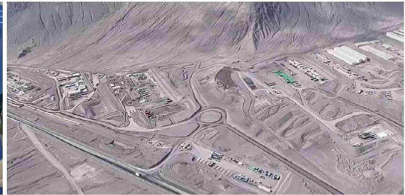
37% de avance lleva la desaladora para CODELCO.