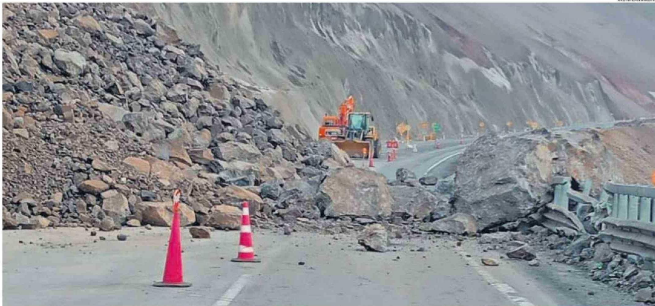
SI BIEN LOS SUCESIVOS DERRUMBES HAN DISMINUIDO ÚLTIMAMENTE, Y SE RESPONDE RÁPIDO PARA DESPEJAR, SE VE LEJOS UN FIN DEFINITIVO