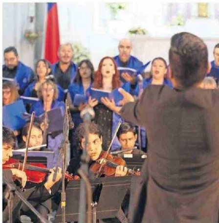
UA LAS AGRUPACIONES INTERPRETARÁN CLÁSICOS CHILENOS.

Se tratará de un show especial, marcado además por el inicio de las siempre tan esperadas Fiestas Patrias. Por ello, los integrantes del coro y orquesta interpretarán un repertorio exclusivo con clásicos de la música criolla chilena, para así dar el puntapié inicial a las festividades de septiembre y a las realiza-