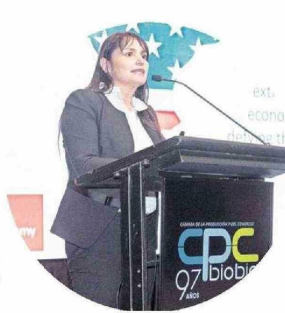
La destacada economista Michéle Labbé fue la encargada de exponer en la actividad.