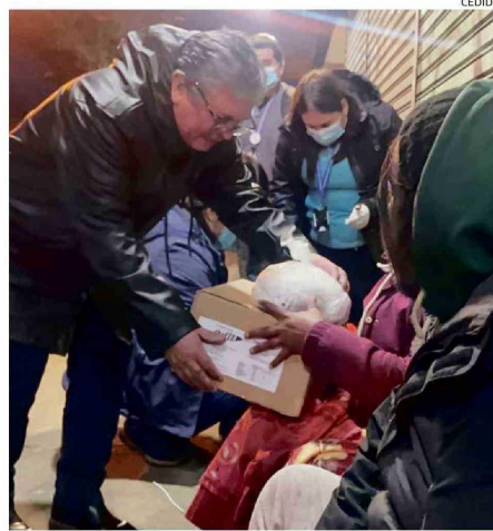
EL SEREMI DE DESARROLLO SOCIAL EN UNA DE LAS RUTAS CALLE.