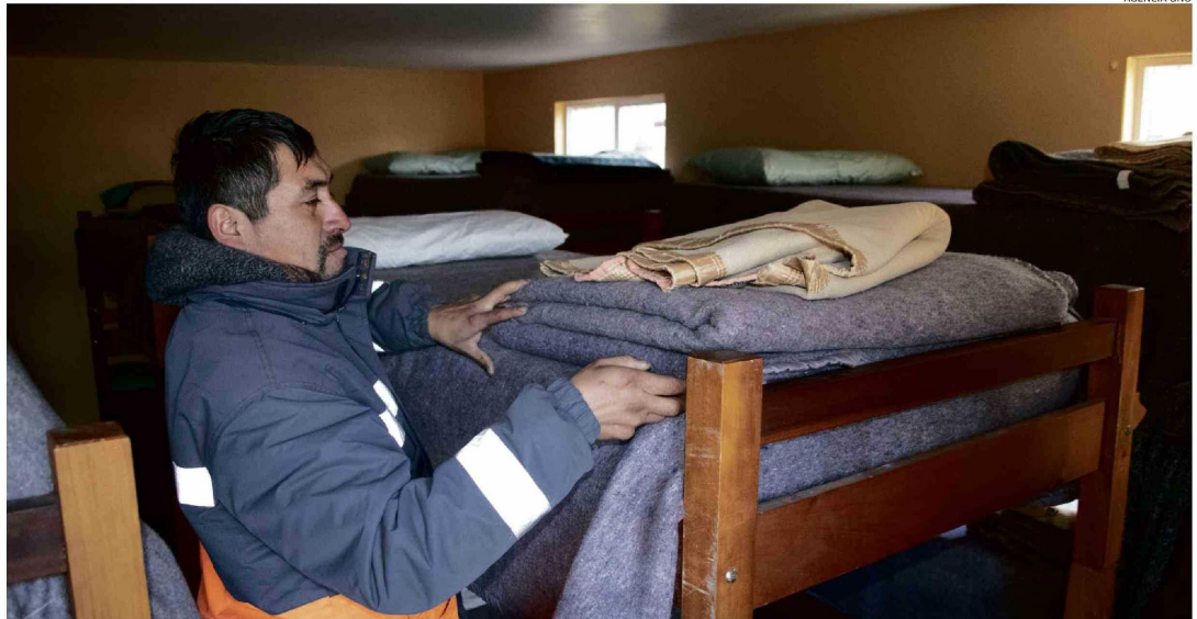
LOS ALBERGUES PÚBLICOS O PRIVADOS, COMO EL UBICADO EN RAHUEN ALTO, AL LADO DE LA PARROQUIA SAN LEOPOLDO MANDIC, SON UNA OPCIÓN PARA PASAR LAS FRÍAS NOCHES.

Según reportes del Mideso, la cifra para 2024 de personas en situación de calle llega a 21.272, donde la mayoría se concentra en la regiones Metropolitana, de Valparaíso y Biobío. En el caso de la Región