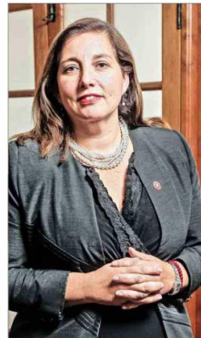
La senadora Paulina Vodanovic (PS) buscará la reelección.