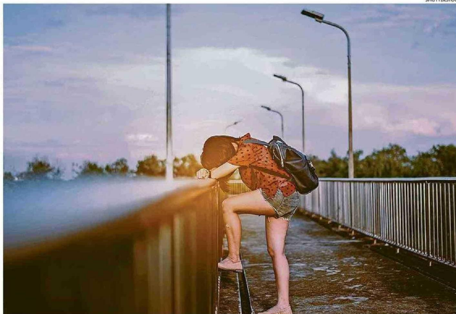
LA ORGANIZACIÓN MUNDIAL DE LA SALUD (OMS) ASEGURA QUE EL SUICIDIO ES UN PROBLEMA DE SALUD PÚBLICA A NIVEL GLOBAL.

“El proyecto se originó a partir de la identificación de una necesidad urgente en la Región de La Araucanía: las alarmantes tasas de suicidio, que colocan a esta área como una de las regiones con índices más elevados en el país. Este contexto nos llevó a reflexionar sobre el potencial de la fonoaudiología para abordar esta comple-