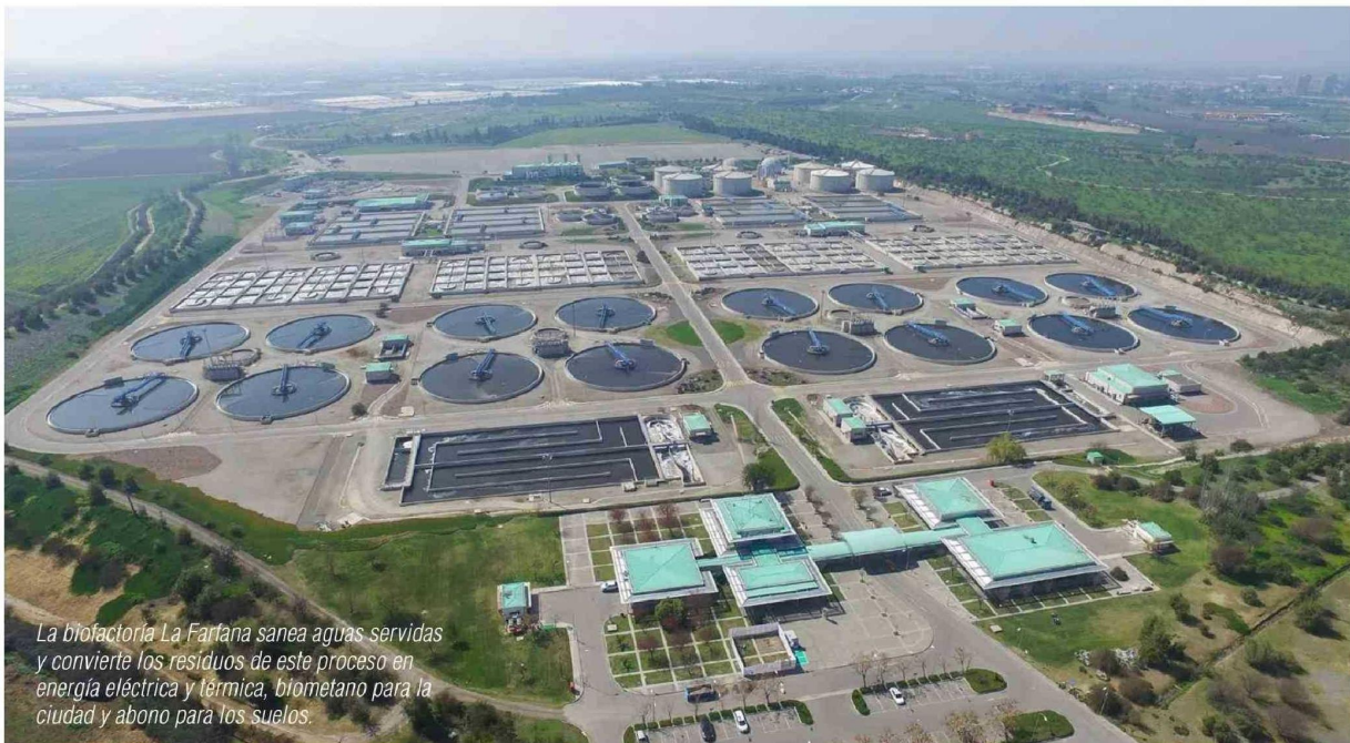
La biofactoría La Farfana sana aguas servidas y convierte los residuos de este proceso en energía eléctrica y térmica, biometano para la ciudad y abono para los suelos.

Desde 2013, en la RM se trata el 100% de las aguas residuales lo que ha traído relevantes beneficios sociales, ambientales y económicos. Revisamos ejemplos.