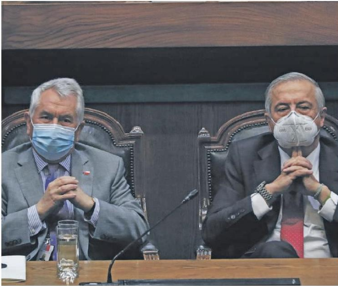
Enrique París y Jaime Mañalich, los dos titulares de Salud durante la pandemia.

Miradas. Expertos desmenuzan gestión oficial del covid-19, con ya más de 20 mil fallecidos y cerca de 650 mil contagiados.