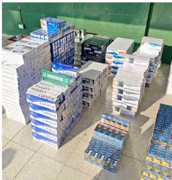
El precio de los cigarrillos ilícitos se concentra en el rango de $1.501 a $2.000.

El volumen del precio de los cigarrillos ilícitos aumenta en compara-