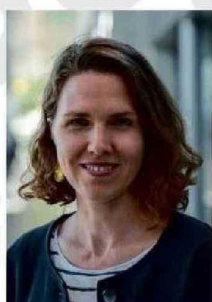
Encargada de Asuntos Económicos y jefa subrogante del Swiss Business Hub de la Embajada de Suiza en Chile