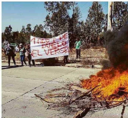
VECINOS SE HAN MANIFESTADO ANTERIORMENTE POR LENTITUD.

“Empezaron a robar las cosas de las casas que están en construcción. Durante la madrugada del sábado al domingo, se robaron la puerta principal y los ventanales de una de las casas y además, rompieron otras cosas. Esto lo hacen los delincuentes porque hay muy poca vigilancia y nosotros vamos a pelear con Serviu para que nos entreguen las casas,