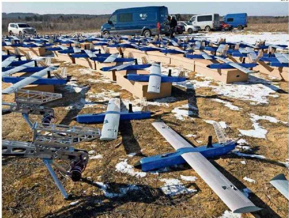
UNA FLOTA DE DRONES INTERCEPTORES DE UCRANIA.

También se dispararon tres misiles balísticos, según la fuerza aérea. Una persona murió en