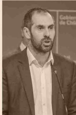
NICOLÁS GRAU MINISTRO DE ECONOMÍA

"Esto demuestra que la institucionalidad de todas maneras funciona", dijo respecto a la señal que muestra el fallo al resto de los proyectos de inversión.