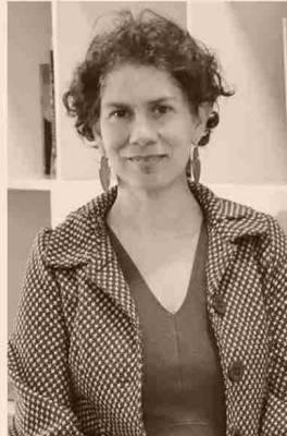
MAISA ROJAS MINISTRA DE MEDIO AMBIENTE

"Esta votación hay que repetirla". Sobre la reforma a la ley que regula el SEA, indicó: "Nuestra propuesta es que deje de existir el Comité de Ministros".