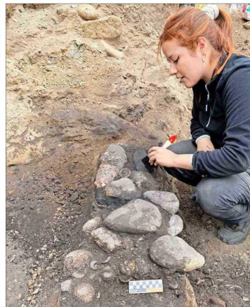
Trabajos de arqueología en ruta costera Viña del Mar-Concón.

Durante el primer semestre, se envió a la Secretaría General de la Presidencia el nuevo Reglamento de Inter-