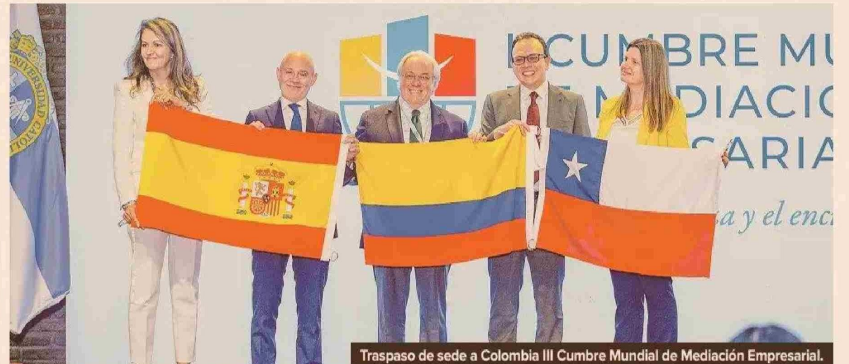
Traspaso de sede a Colombia III Cumbre Mundial de Mediación Empresarial.