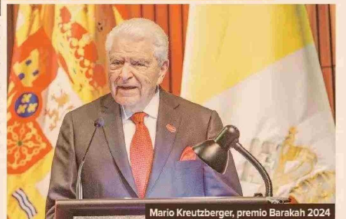
Mario Kreutzberger, premio Barakah 2024