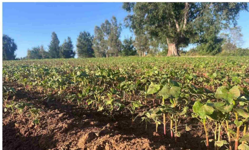
Alforfón en crecimiento.