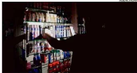
La emergencia no quedó resuelta anoche.

Nada más declararse la emergencia, el presidente de la República, Gabriel Boric, se desplazó a la Central de Gestión Operativa de Carabineros de Chile para monitorear la emergencia y luego sobrevoló en un helicóptero la capital, donde vive casi la mitad