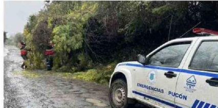
MUNICIPALIDAD DE PUCÓN