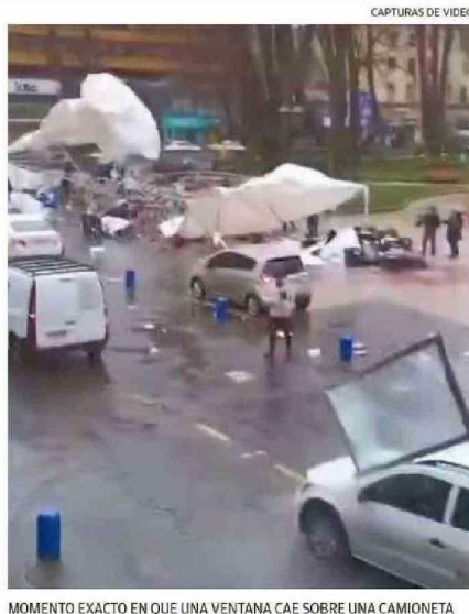
CAPTURAS DE VIDEO