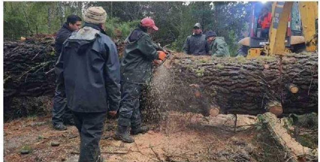
MUNICIPALIDAD DE CUNCO