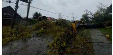
MUNICIPALIDAD DE VILLARRICA