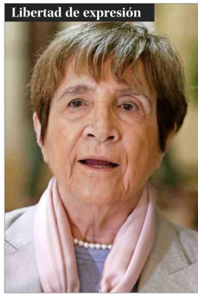
Libertad de expresión

El fin de semana, el presidente del PC, Lautaro Carmona, defendió que en ese país "hay separación de poderes. No sé en Chile si están separados o no".