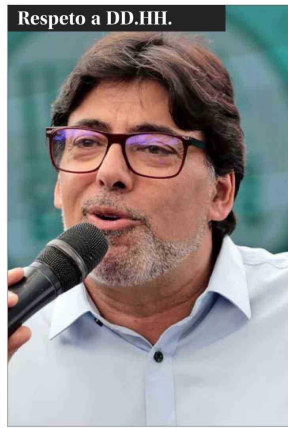
Respeto a DD.HH.

"En este país (Venezuela), donde todos dicen que no hay separación de poderes, enterarnos y poder contarle al mundo que hay cientos de agentes del Estado condenados por violaciones a los DD.HH."