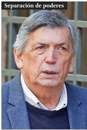
Separación de poderes

"No es dictadura. No puedo apurarme en definir una dictadura si conozco que hay separación de poderes (en Venezuela). No sé en Chile si están separados o no".