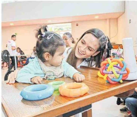
Uno de los logros más destacados es que se dio atención presencial a casi el 100% de los usuarios, priorizando a los menores de 5 años.

cuenta que la sede regional brindó, sin costo alguno para las familias, atención y tratamientos a 3 mil 499 pacientes, contribuyendo en su rehabilitación física e inclusión social. A lo anterior se suma que la institución dio la