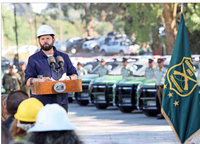
El Presidente Gabriel Boric se refirió a la detención de María Corina Machado —quien fue posteriormente liberada— en Concepción. Lo hizo al realizar una actividad de entrega de vehículos policiales a Carabineros del Biobío.

El Presidente relató a los asistentes ser "una persona de izquierda y desde la izquierda política les digo que el gobierno de Nicolás Maduro es una dictadura y tenemos que hacer todos los esfuerzos internacionales para que se restablezca la ley, la democracia. Todos los esfuerzos para que el pueblo de Venezuela tenga el derecho a decidir su propio destino; es la postura del Gobierno de Chile que hemos defendido desde un principio y