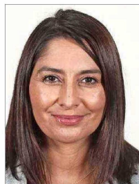
NATHALIE CASTILLO DIPUTADA COMUNISTA

“ Hay una información algo contradictoria (...); vamos a esperar un poco para tener el dato definitivo. Como en todas las dictaduras y tiranías, (es) un hecho repudiable”.