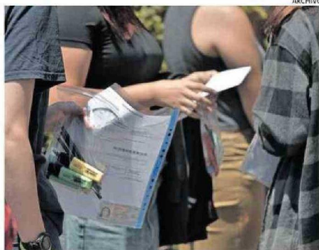
MILES DE ESTUDIANTES RENDIRÁN EL EXAMEN.