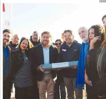
AUTORIDADES Y DIRIGENTES SOCIALES EN LA CEREMONIA EN FREIRINA.

FREIRINA. Con la presencia del ministro Montes colocaron la primera piedra.