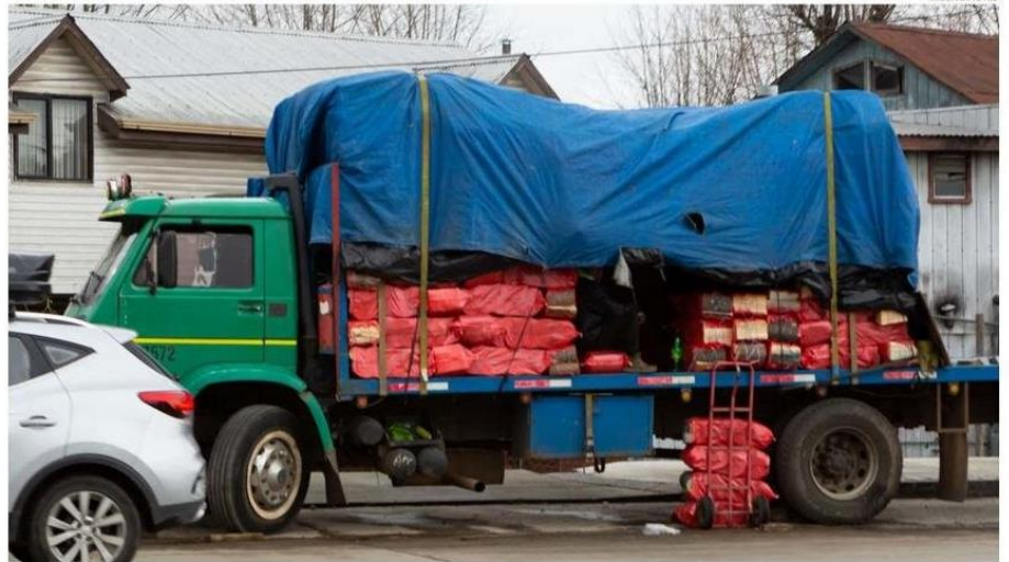
LA SEREMI DE ENERGÍA EXPLICA QUE HAN REALIZADO UNA SERIE DE FISCALIZACIONES A LOS CAMIONES QUE COMERCIALIZAN LEÑA.