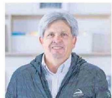
Jorge Maturana Presidente Cámara Chilena de la Construcción Antofagasta

No es desconocido que el Plan de Emergencia Habitacional (PEH) ha sido uno de los dolores de cabeza para el gobierno en la región. Con un pauperismo avance a noviembre del 2025 (28,7%), la zona es la más atrasada a nivel nacional.